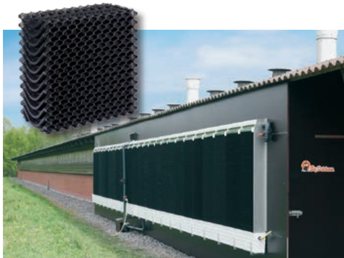
RainMaker, műanyag Pad betétekkel

zásra, ahol forró és száraz a nyár. Mert a hűtőhatás annál nagyobb, minél magasabb a hőmérséklet és minél kisebb a relatív páratartalom. Az alkalmazásra kerülő Pad betétek speciális cellulózsövetből készülnek különösen nagy felülettel → magas hűtési teljesítmény. A kémiai impregnálás védi a Pad betéteket az időjárási behatásoktól. Alternatívaként kínálunk még műanyag betétet is, mely könnyebben takarítható és hosszabb élettartamú.