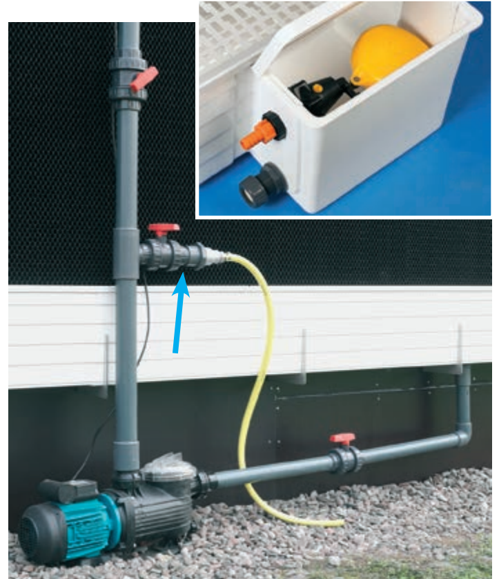
Keringető szivattyú szűrővel és leeresztővel

A RainMaker, üzem közben, a víz egy részét elpárologtatja és az ásványi anyag tartalom a keringő vízben nő. A Pad betéteken való lerakódások megelőzésére ennek a víznek egy részét folyamatosan el kell vezetni egy víz-leeresztőn keresztül (Bleed off). Az elvezetendő mennyiség a vízminőségtől és az elpárologtatott víz mennyiségétől függ. Ököl szabályként érvényes: az átfolyó víz 10%-a (jó minőség esetén). Opcióként kínálunk egy ellátó egységet. Ez megkönnyíti a karbantartási munkákat, mivel könnyebb hozzá férni az úszószelepphez.