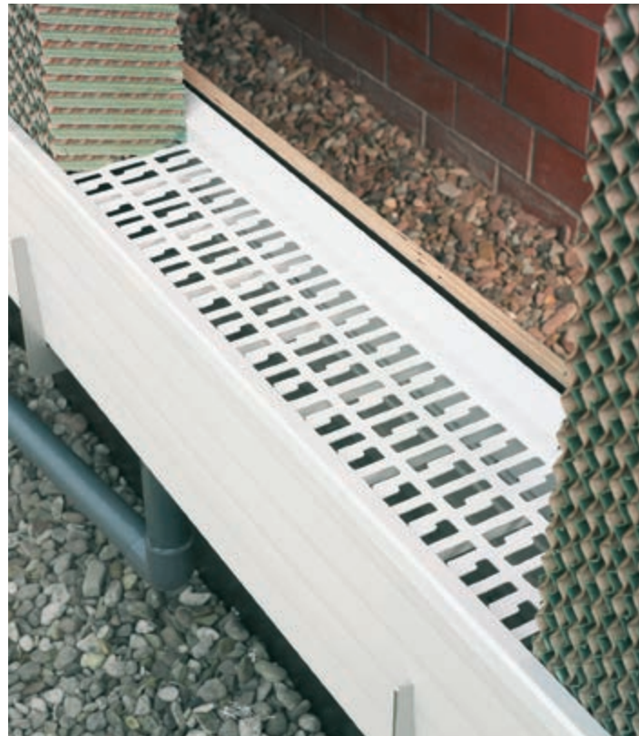
Vízfelfogó vályú méterenként 48 liter vízmennyiségig

A felesleges vizet a vázszerkezet alsó részében – víztároló vályúban – fogják fel és újra visszavezetik a hűtővíz körbe. A speciális profil kialakítás jó stabilitást biztosít. A vályút úgy méretezték, hogy további víztankra nincs szükség. A vályút fedő burkolatot, amin a Pad betétek állnak, egyszerűen rápattintják a vályúra és karbantartási munkák esetén le lehet venni. A speciális perforáció biztosítja a felesleges vízmennyiség visszafolyását és egyben megakadályozza a rágcsálók bejutását a vályúba.