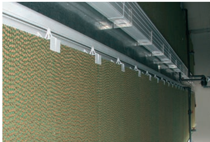
Dupla RainMaker rendszer nagy belmagasságú ketreces istállóhoz