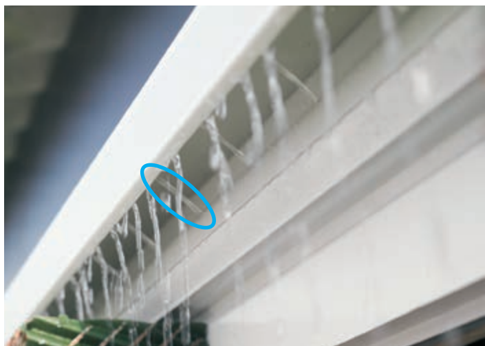
Top profil perforált vízvezető csővel és a deflektorral, mely az egyenletes vízelosztást biztosítja a betét tetejére