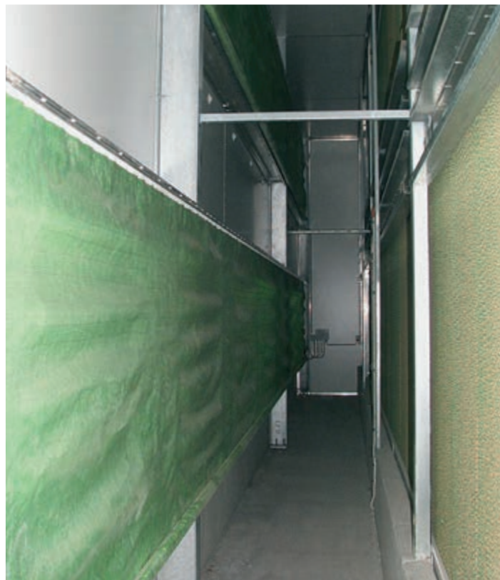
Alagút légbeejtő rolós függönnyel