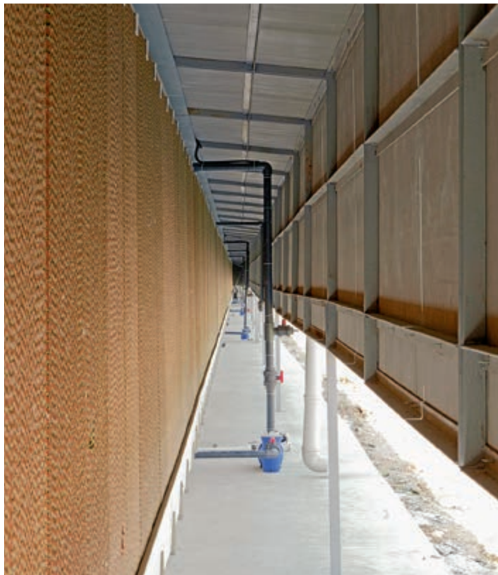
Szél- és porvédelem, valamint a Pad nincs kitéve közvetlen napsugárzásnak